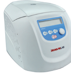
Yüksek Hızlı Micro-Santrifüj Soğutmalı