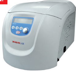
Yüksek Hızlı Micro-Santrifüj